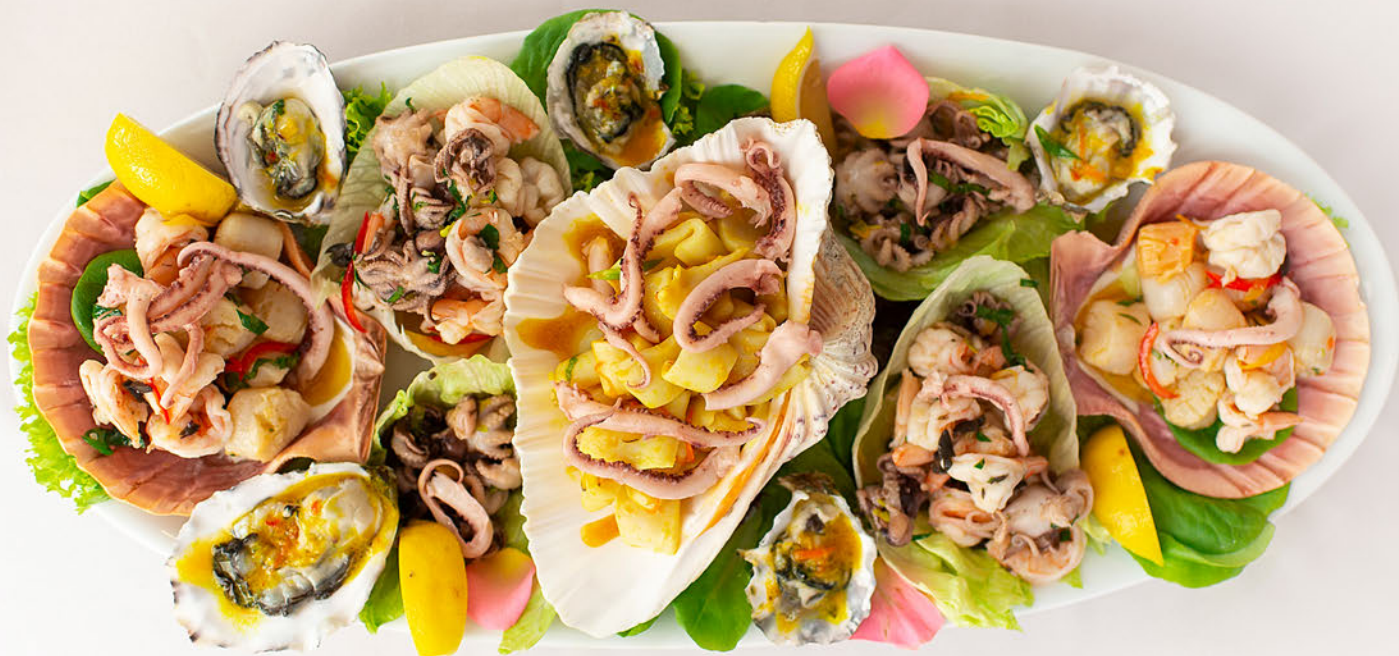
ХОЛОДНОЕ АССОРТИ ИЗ МОРЕПРОДУКТОВ на 8 персон 6700Р